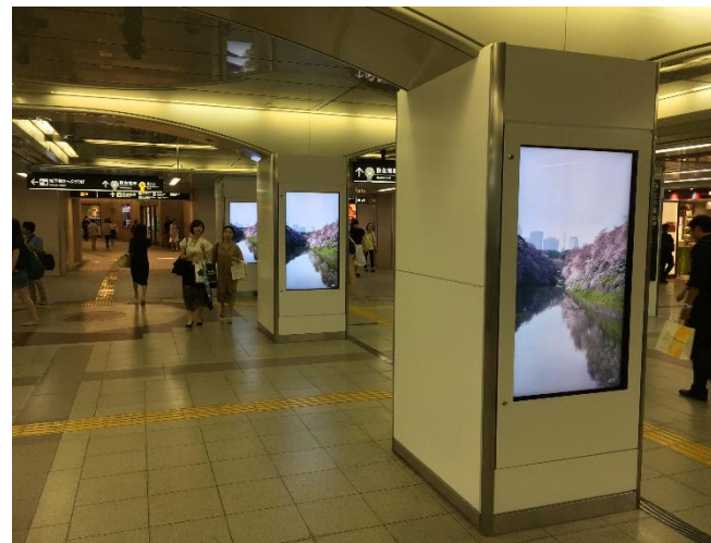
中コンコース (イメージ)