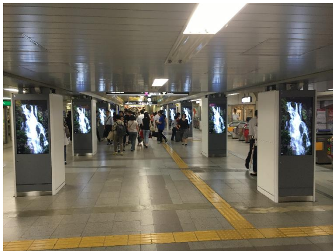
北コンコース (イメージ)