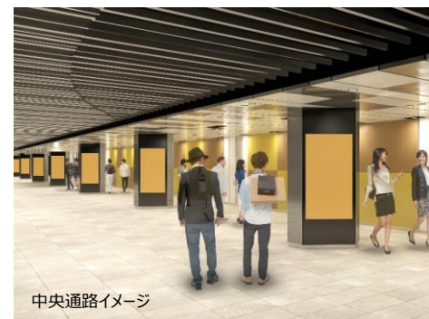
中央通路イメージ