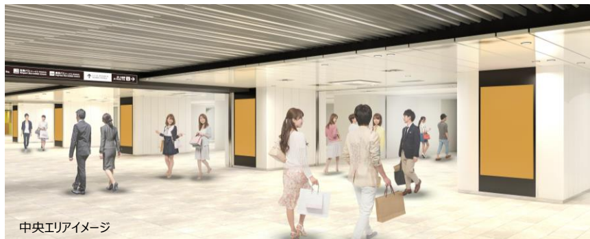
中央エリアイメージ

JR大阪駅に向かう通行人に対し5面の大型ディスプレイでインパクトのある展開が可能。