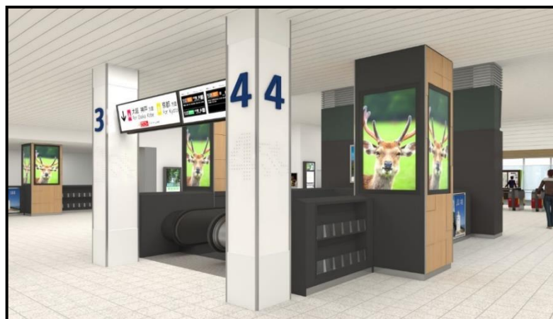
駅利用者視点からの見え方を、コチラから動画でご覧いただけます→

乗降人員：48,072人/日(2018/11/13調べ) 乗換利用人員：約39,000人/日