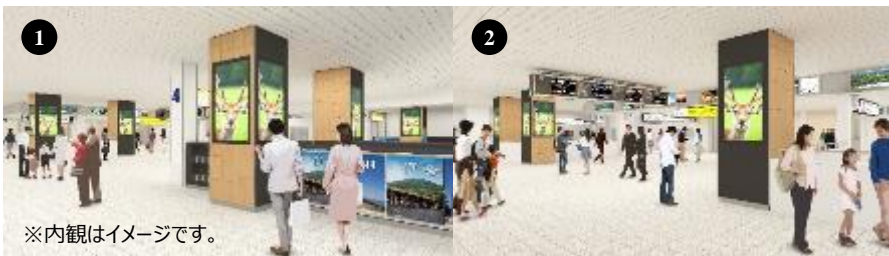
※内観はイメージです。