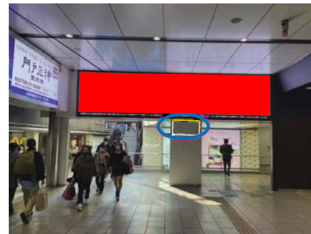
【スピーカー設置箇所】