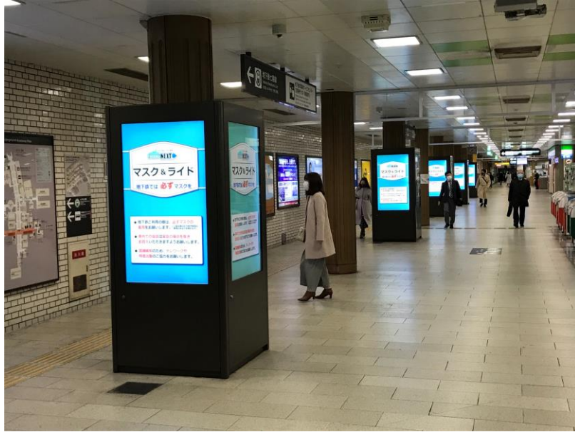
(既存) 西側コンコース 60インチモニター15面