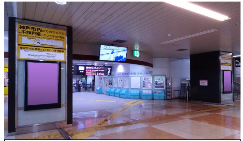
乗降人員(1日平均): 19,900人 ※(2020年度JR西日本交通広告データブックより)