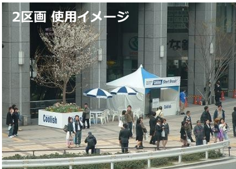
※イメージ写真は他会場のものです。