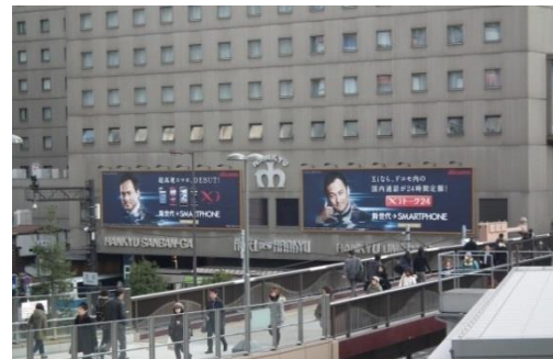
◎JR大阪ノースゲートビルから阪急梅田駅への連絡橋からご覧頂けます。