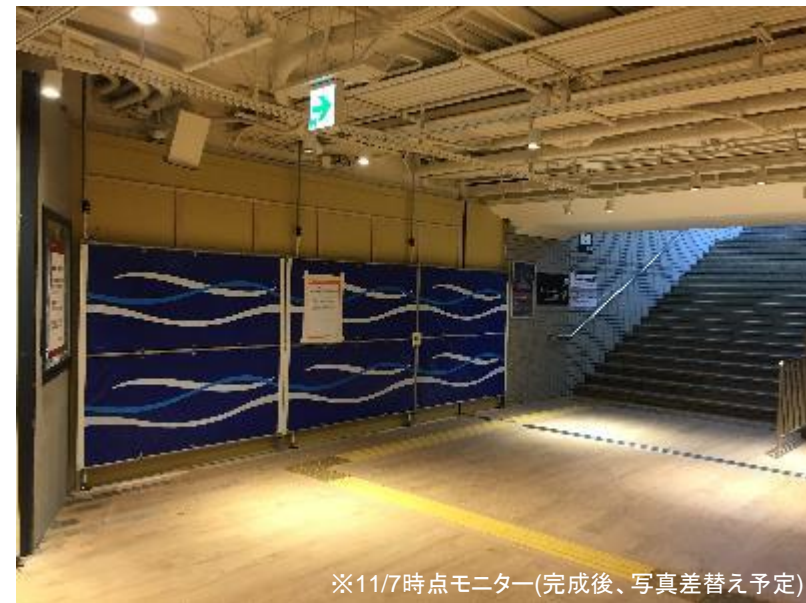
※11/7時点モニター(完成後、写真差替え予定)