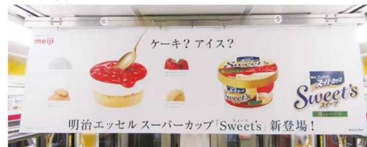
ワイド/H364mm × W1,030mm (B3×2) ポスター用紙：コート110kgまたはコート135kg