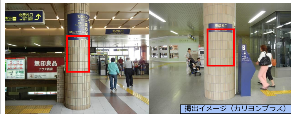
掲出イメージ（カリヨンプラス）