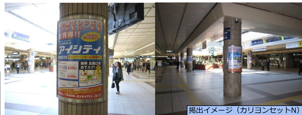
掲出イメージ（カリヨンセットN）