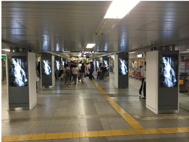
北コンコース (イメージ)