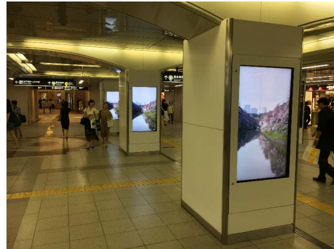
中コンコース (イメージ)