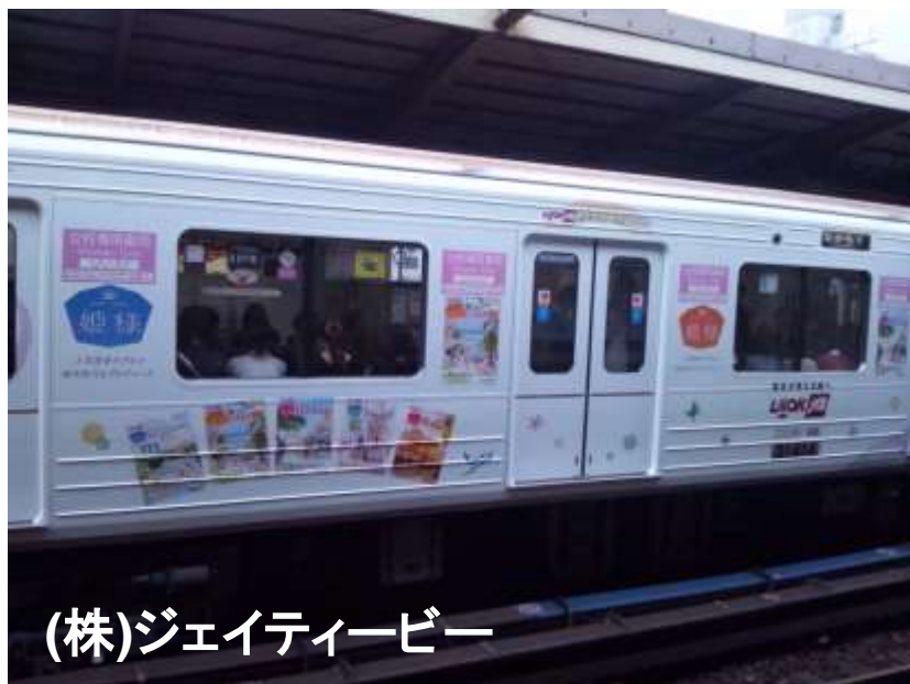
(株)ジェイティービー