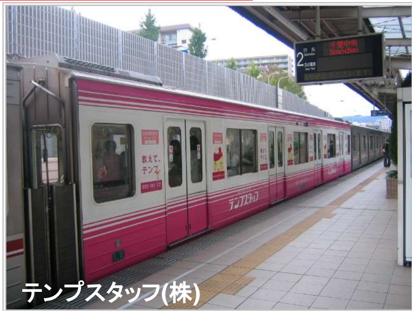
テンプスタッフ(株)