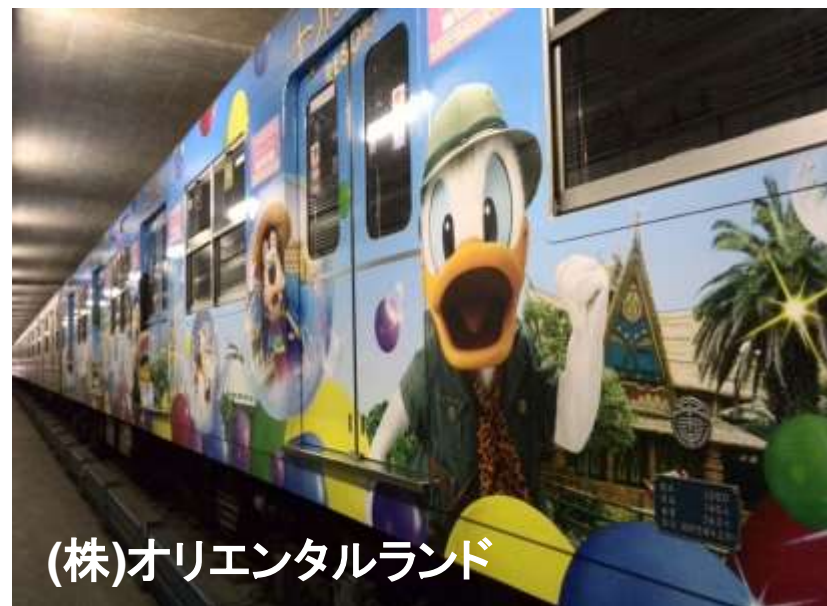
(株)オリエンタルランド